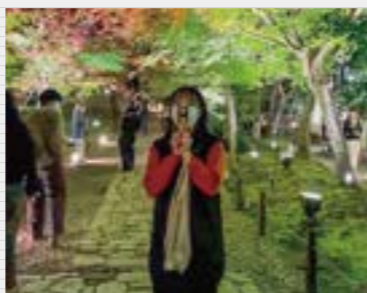
休日はお寺巡りをよくします。遠くまで出かけることもありますが、近場のお寺でも癒やされます。これは大学からも近い箕面市の勝尾寺に行ったときの写真です。

藍野大学に入学したおかげで、楽しいときには笑いあい、つらいときには支えあえる最高の友人と出会えました。また、作業療法士として臨床に立たれている先生方は、私たちにとって尊敬する先輩。学生一人ひとりに寄り添い、学生のうちに失敗を経験することで成長できることを教えてください。医療職をめざす学部しかないからこそ、互いに親近感があり、高めあえるのも本学の強み。同志とも呼べる友人たちと勉強に専念できる、とてもいい環境です。毎日が楽しく、最高のキャンパスライフを送っています。特に、同学科のみんなとは、切磋琢磨しながら実習や国家試験、就職後に向けた勉強を一緒に頑張れる、固い絆で結ばれています。