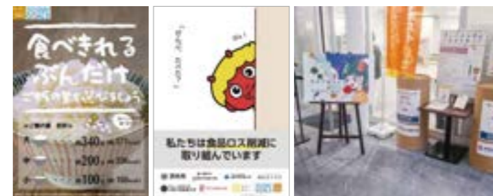
食べきれざるご飯の量パネル 茨木市と市内大学共同の食品ロス削減啓発ポスター 学生デザインを採用した啓発パネルの設置

2022年5月、環境省が食品ロス削減と食品リサイクルを実効的に推進するための先進的事例を創出し、広く情報発信・横展開を図ることを目的とした「令和4年度 地方公共団体及び事業者等による食品廃棄ゼロエリア創出の推進モデル事業等」に採択されました。本プロジェクトは、大阪茨木キャンパスを中心に、食品ロス削減の意識を育み、学生食堂から食品廃棄物をなくそうという取り組みです。学生食堂における食事準備量の最適化、食べきれざるご飯量の設定、食事メニューサンプルの写真化、アンケートの実施、学生デザインを採用した啓発パネルの設置などを行い、学生・生徒、教職員の自発的な『学び合い』の空間を広げています。