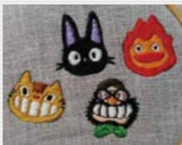
色々なものを手作りすることが好きで手芸が趣味です。これは最近上手くできた刺繍。かわいい柄をチクチク縫うと、とてもリフレッシュできます。