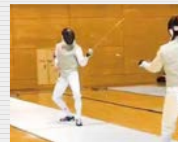
高校からフェンシング部に所属。「戦うチェス」といわれるフェンシングは、いかに的確な戦いをするかが勝負。仲間と切磋琢磨しながら練習に励んでいます。