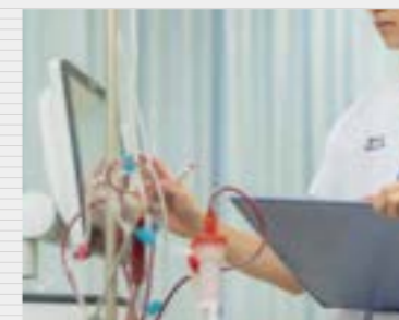
好きな授業は人工心肺制御学。人工心肺業務に熱い思いを持たれている先生の講義は実践的で興味深く、日々の勉強のモチベーションが高まります。

藍野大学は先生と学生の距離感が近く、疑問に感じたことや課題でわからないことがあれば、空き時間に先生方の研究室を訪ねるなど、気軽に質問できる環境にあります。臨床工学科の先生方が学生思いで優しい人たちばかりなもの、自慢できるポイントです。同学科の学生たちの仲も良く、みんな思いやりがあって、何かあればすぐに助けあえる。グループに分かれて行う実習や実験は、先生も含めてみんなでわいわい楽しく取り組んでいます。実務経験を重ねてきた先生方は、業務に対して熱意や誇り、やりがいを持たれていて、自分にとっての理想の臨床工学技士像となっています。尊敬する先生方を目標に、患者さんにも周りの医療従事者にも慕われるような医療人になりたいです。